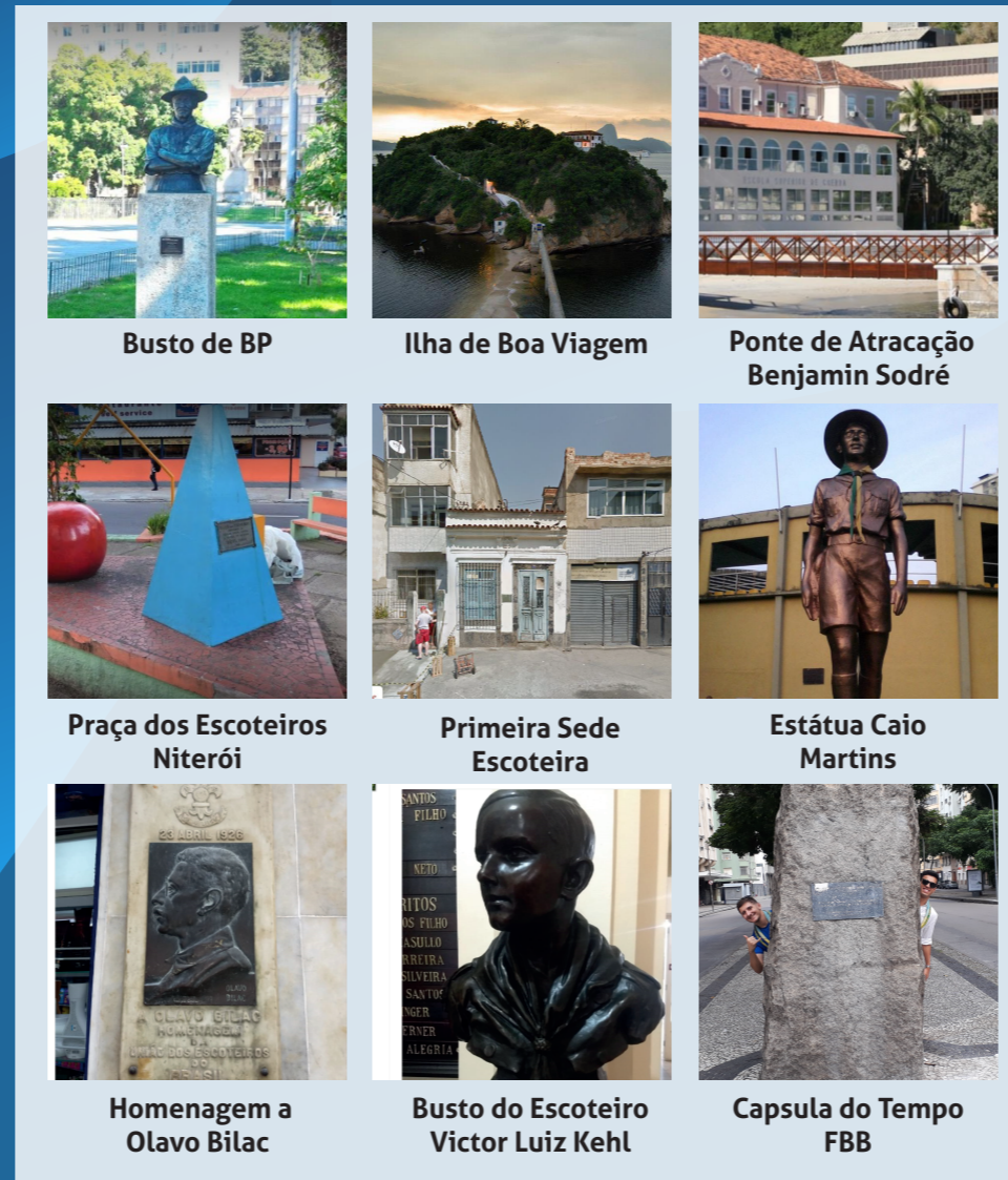
Busto de BP